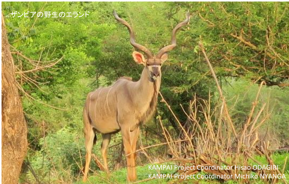
ザンビアの野生のエランド